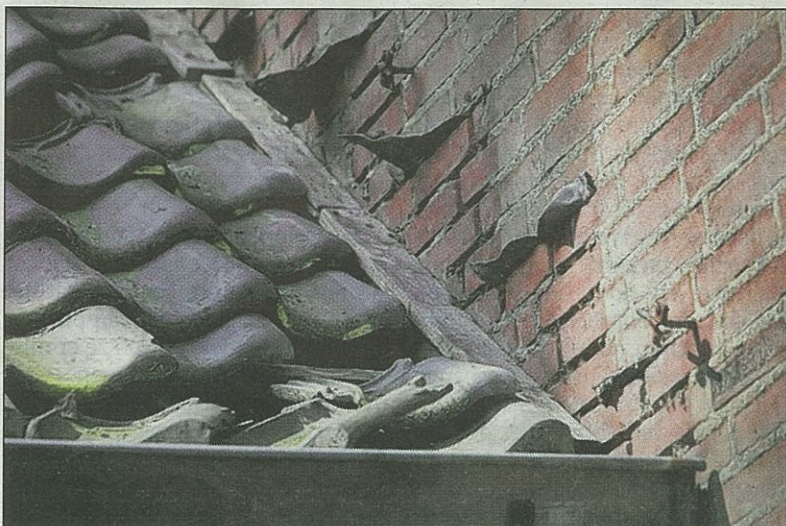
Lood en koper is gestolen rondom het dak van de kerk in Maliskamp.

De Bernadettekerk wordt gerenoveerd en krijgt een functie die past in de omgeving waar ook de begraafplaats is. Na de zomer worden de definitieve plannen bekend.