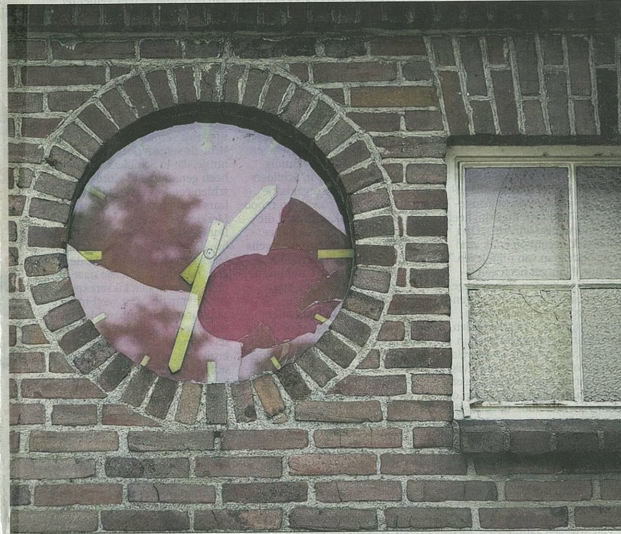
Bernadettekerk. Ramen zijn ingegooid, baldadige jeugd is opgepakt, zwervers zijn gesignaleerd.